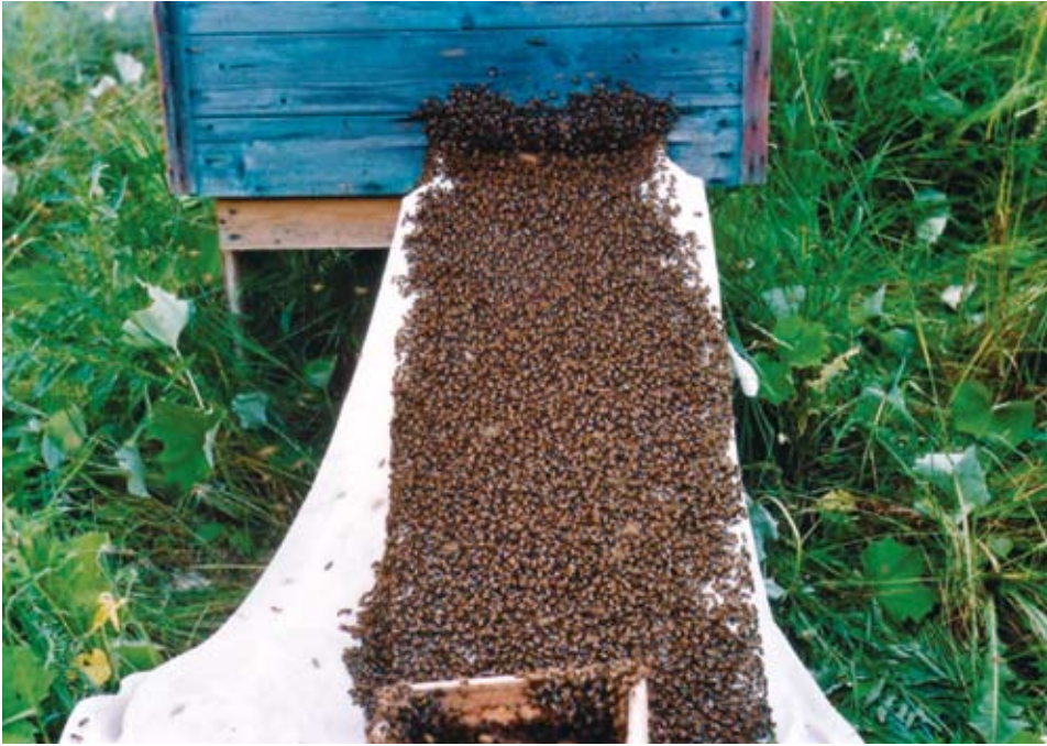
Sülem siseneb kastist tarru

mida pole töödeldud agrokemikaalidega. See tähendab, et kui 3 km raadiuses paiknevad tavapõllud, mida pestitsiididega pritsitakse, siis mahemesindusega tegeleda ei saa. Samuti ei või selles piirkonnas kasvada geneetiliselt muundatud taimed. Mesila peab olema piisavalt kaugel suurematest saasteallikatest, nagu linnad, tööstuspiirkonnad, intensiivse liiklusega maanteed, prügilad, jäätmepõletuskohad. See nõue ei kehti mesilasperede talvitumise ajal, sest siis mesilased tarust välja ei lenda ja korjel ei käi.