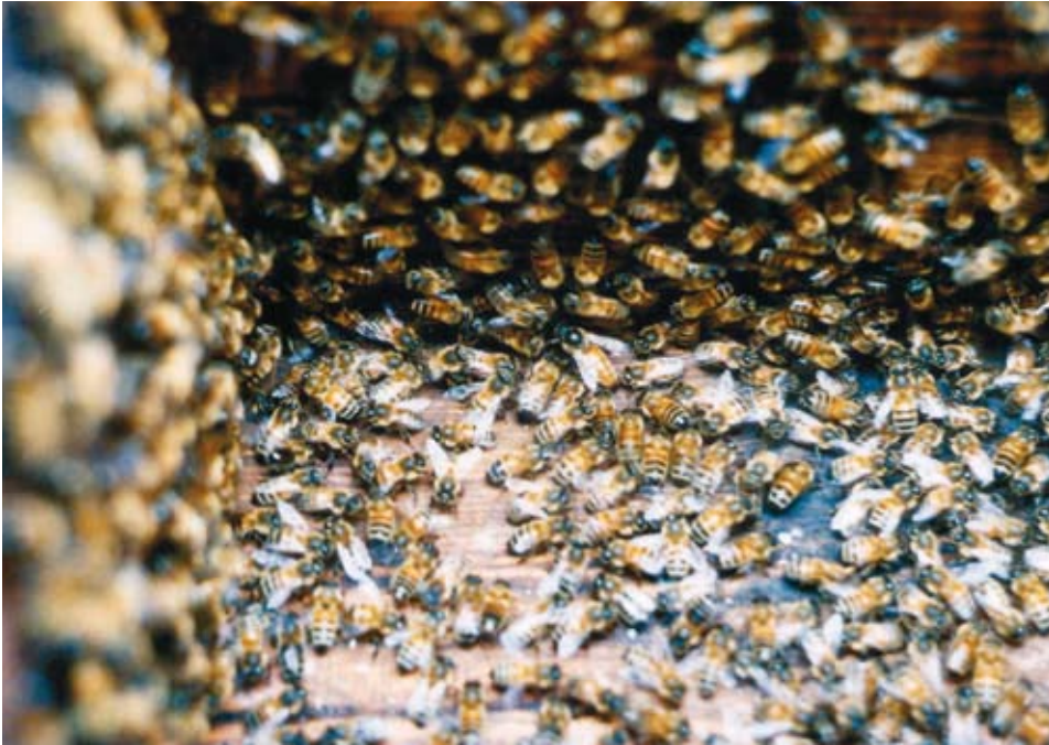
Sülem siseneb, keskel mesilasema

Niisugusest rikkaliku koostisega algainest valmistavad mesilased veelgi rikkalikuma koostisega naturaalse mee. Ja nii on see olnud miljonid aastaid. 20. sajandil laialt levima hakanud "suhkrumeesindus" hakkas eirama seda, mis loodus oli ammu paika pannud, ja kuulutas, et kogu nektari poolt pakutava rikkuse võib vabalt asendada üheainsa imelise aine – sahharoosiga. Pealegi jätvat see vähe seedejääke ja vähendavat seega oluliselt tagasoole täitumust talvel ja parandavat seeläbi mesilasperede talvitumist. Tõepoolest, mõned katsed on seda kinnitanud. Kuid teised katsed ja paljude mesinike praktika räägib muust: suhkruliigsöötmise viib järgmisel aastal meesaagi vähenemisele ja mee kvaliteedi langusele. Pärast talvitumist ühekülgse suhkrumeel ei ole mesilased enam nii energilised ja eluvõimeli-