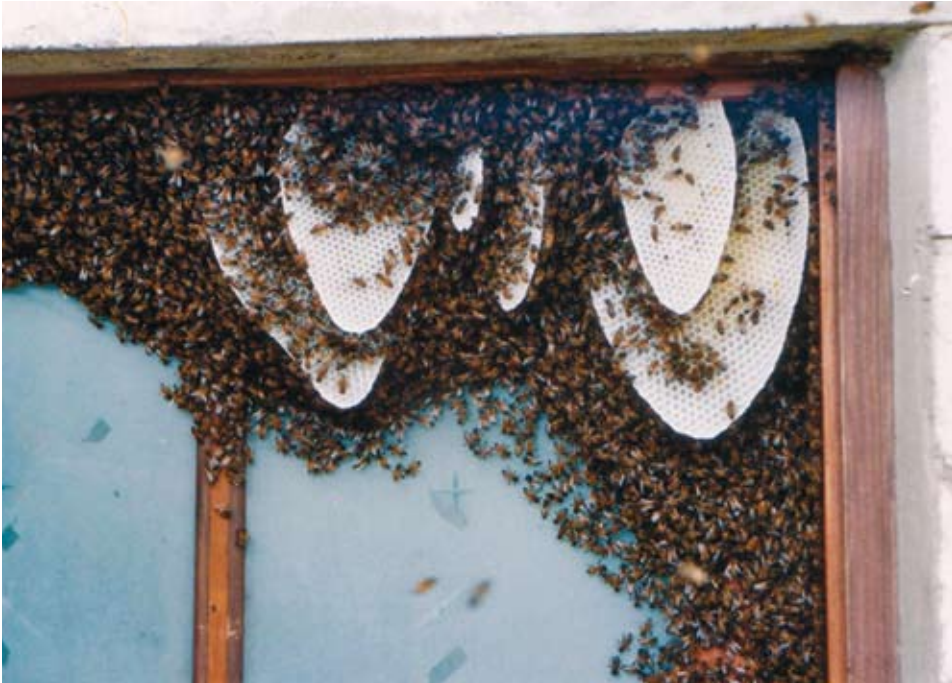
Sülem on asunud elama kahe ukse vahelisse ruumi (väline uks on lahti) ja on alustanud loomulikku pesaehitust

haudme kõrvale võib põhjustada haudmemädanikku. Suirakärgi ei tohiks paigutada ühest perest teise, veelgi vähem ühest mesilagrupid teise. Praegusel ajal, mil mesilates levib ohtlik seenhaigus lubihaue, võivad suirakärjed olla ohtlikud. Kärgedes olevas vanas suiras võivad tekkida muutused ja tema loomulik bakterite tasakaal võib saada häiritud, mistõttu seal leiduvad lubihaudme eosed võivad muutuda patogeenseiks.