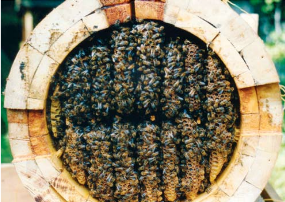
Mesilaste pesaehitus ümmarguses õõnes, vaade alt